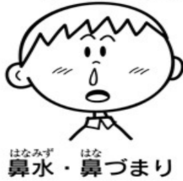
はなみず・はな 鼻水・鼻づまり