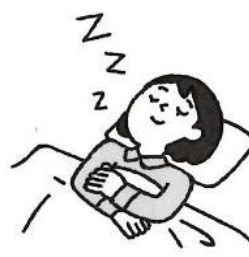
じゅうぶんな睡眠