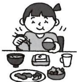
バランスのとれた食事