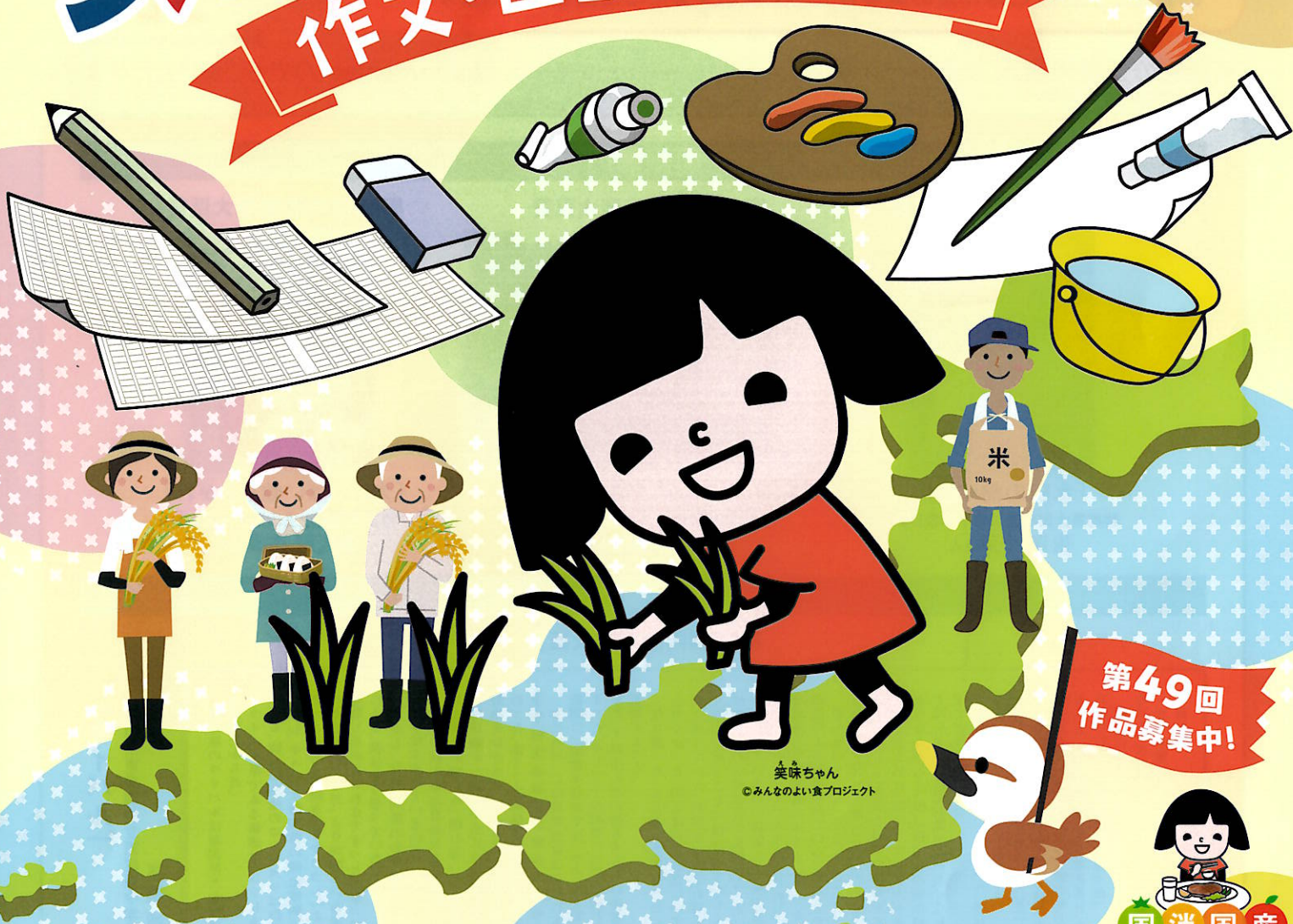
美味ちゃん ©みんなのよい食プロジェクト