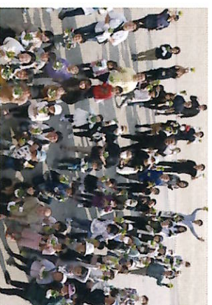
さいたま市立野西北小学校は、地元の児童会と共催で「花いっぱいプロジェクト」取り組みをしています

この助成制度の大きな特長は、環境学習に関わる内容であれば、用途に柔軟な対応が可能なこと。例えば、学習教材の購入、書籍資料の購入、ピクトグラフ作りや管理に必要な道具の購入、社会見学や視察のバスの代などにも使えます。制度を活用して学習を深め、その成果を再びジュニア・エコタイムスにまとめて発表してください。