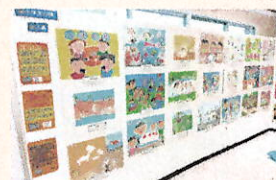
入賞・入選作品巡回展を開催