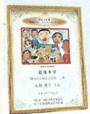
入賞者に記念盾を贈呈