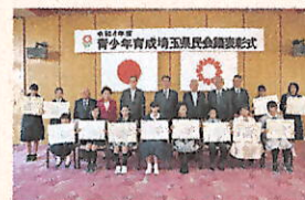
入賞された方を表彰式に御招待

● 問合せ先 青少年育成埼玉県民会議事務局(埼玉県青少年課内) TEL 048-830-2912 FAX 048-830-4754