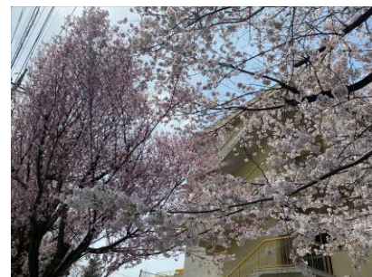
【今年はひがんざくらとソメイヨシノと一緒に咲きました】

今年の春は、降り注ぐ陽光が例年よりも強く輝いているように感じます。その光をいっぱい浴びた桜は、少しせっかちでしたが、子どもたちの入学、進級をお祝いするかのように見事に美しく咲きほころんでいました。保護者の皆様、お子様の入学・進級おめでとうございます。本校は、新たに新入生126名を迎え、全校児童790名で新しい年の教育活動をスタートいたしました。それと共に、この春の人事異動により教職員の入れ替わりがありました。新体制となりますが、教職員一同、力を合わせて子どもたちの望ましい成長のために全力を尽くしてまいりたいと思います。