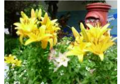
夏の訪れを告げるユリの花

校庭への通路脇のユリが今年もきれいな花を咲かせてくれました。もう夏はすぐそこまで来ているようです。気が付けば、1学期も残すところ1か月半程度となりました。ここまで、4月の「さいたま STEAMS TIME」の実施に始まり、5月は「運動会」、6月は「東京交響楽団 地域巡回コンサート」等、大きな教育活動が続きました。前回の学校だよりでは伝えきれない部分もありましたので、運動会の振り返り等も含め、今月は学校だより6月臨時号を出させていただきます。