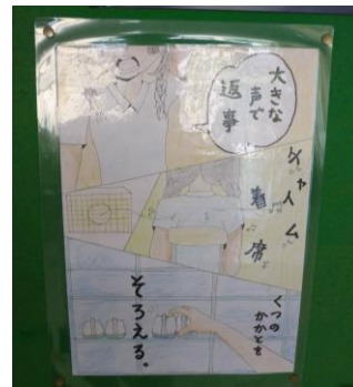
本校昇降口にある小・中一貫のポスター

本校は宮原中学校区の1校として、宮原中学校、つばさ小学校と共に「さいたま市小・中一貫教育」を進めています。宮原中学校区では、生活習慣を定着させるための取組として、①自らあいさつができる ②時間を守る ③くつのかかとをそろえる という共通指導事項をこの数年、継続しています。また、小・中一貫の取組として、小中相互の教員による授業参観や合同研修会、中学校体育祭への児童参加や児童生徒による小・中合同あいさつ運動、つぼみの日 等の実施を検討しております。