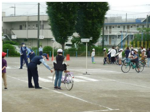
自転車運転免許教室

夏休みも目前に迫ってきました。この時期は、近年、極端な高温や大雨の頻度が長期的に増加する傾向もあるようです。また、気持ちが開放的になる事で、思いもよらない事故に出会う危険性も高まる時期でもあります。そこで、6月中に「スマホ・タブレット教室」(5・6年)自転車運転免許教室(4年)を実施するとともに、7月を「安全月間」と定め、異常気象への危機意識を高める「竜巻訓練」や「夏休みの過ごし方」等について指導を行う予定です。ご家庭でも、「夏休みの過ごし方」について、お子さんとしっかりお話いただき、安全に対する意識高揚に努めていただきますようお願いいたします。