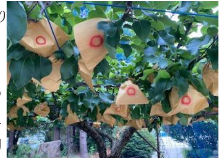
袋掛けした梨の写真

夏本番と言えば、先日、久しぶりに「夏到来」を感じられる地域の行事（奈良別所町夏祭り）に参加することができました。私が本校に着任したのは2年前のコロナ禍の真っただ中。この地域の活動も一切体験していないため非常に楽しみにしていたのですが、想像以上の盛り上がりでした。