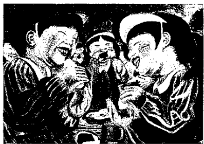
「めっちゃおいしいね!」