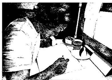
「おむすびは勉強のおとも」